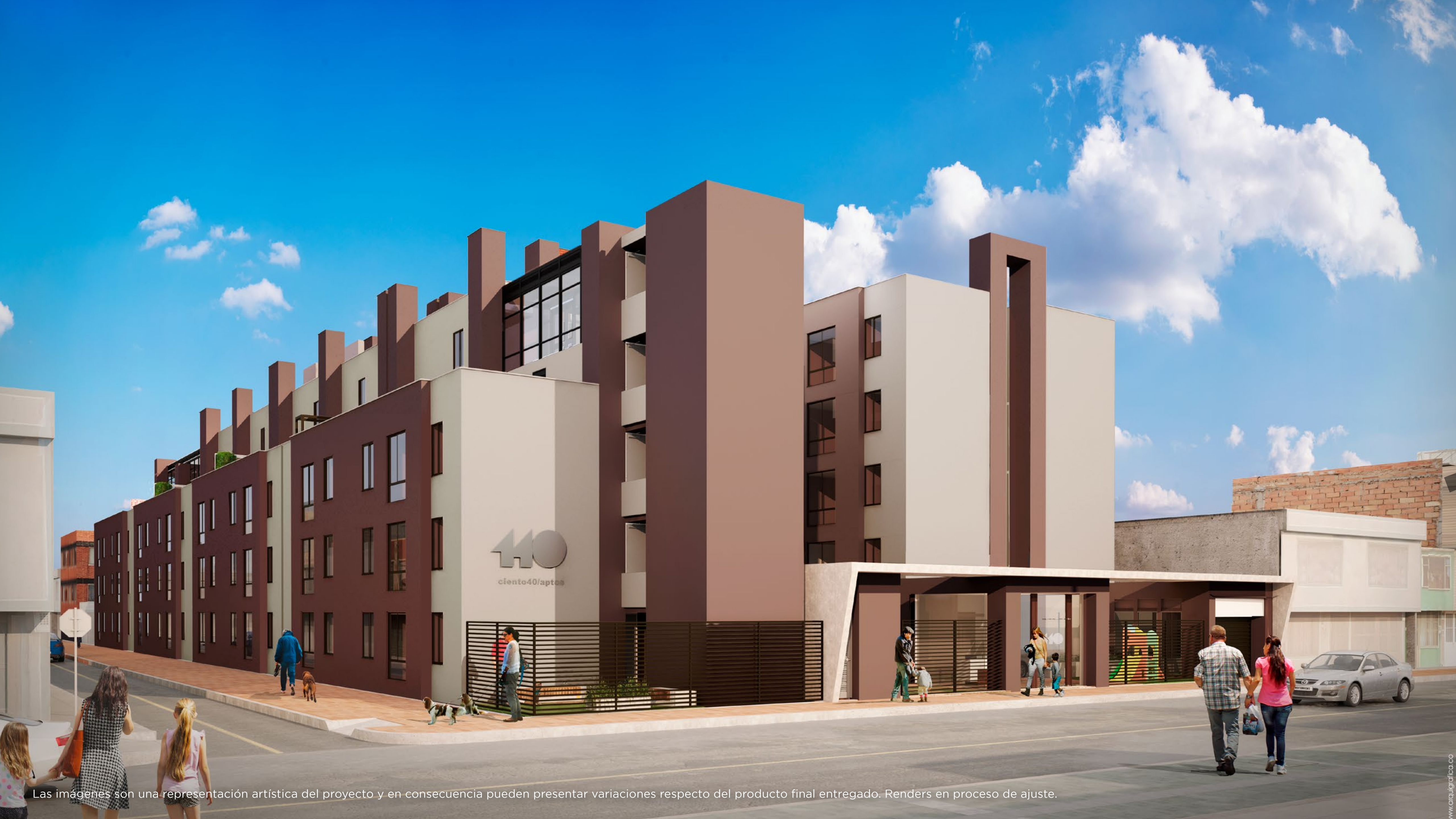
Las imágenes son una representación artística del proyecto y en consecuencia pueden presentar variaciones respecto del producto final entregado. Renders en proceso de ajuste.