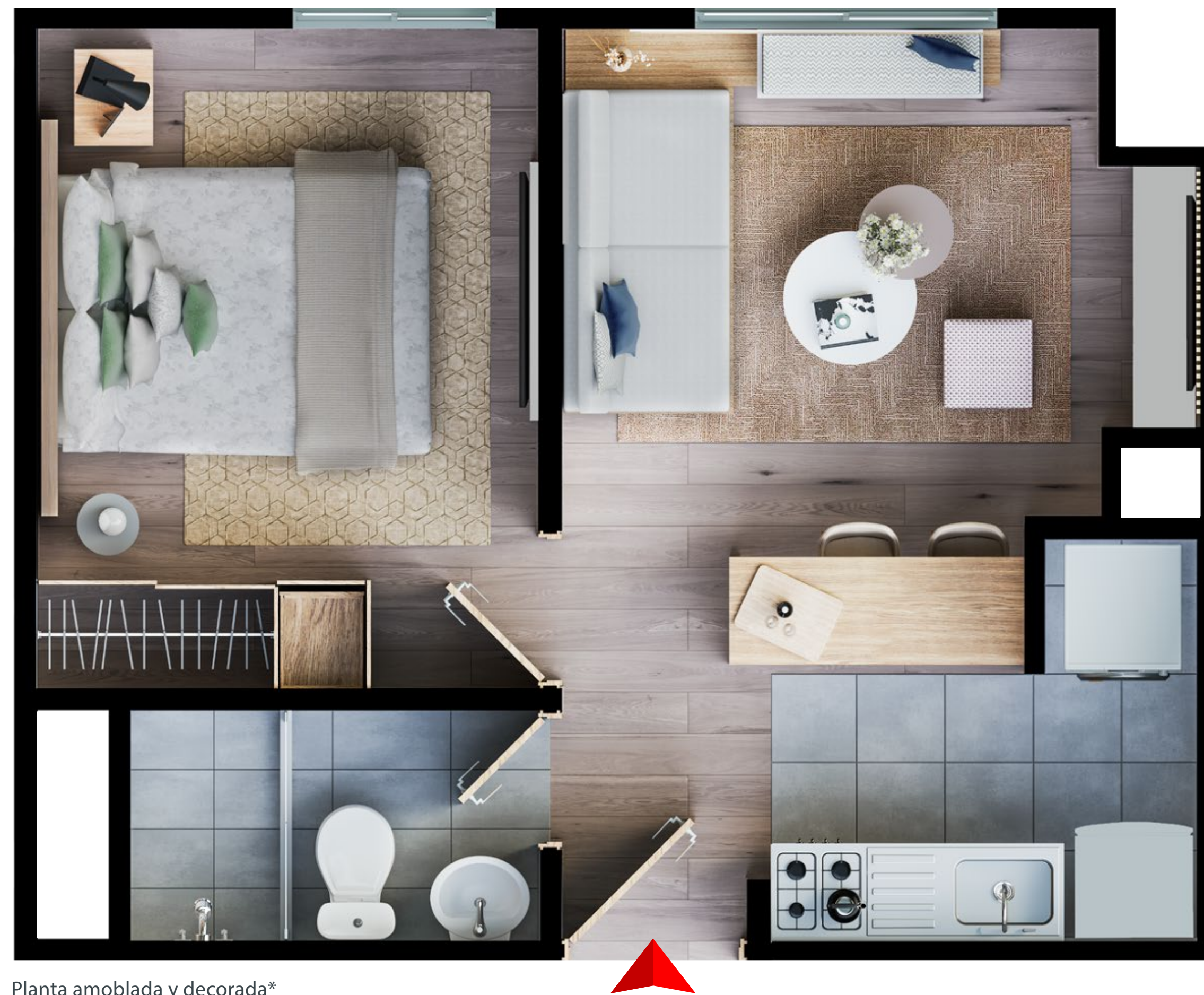
Planta amoblada y decorada*