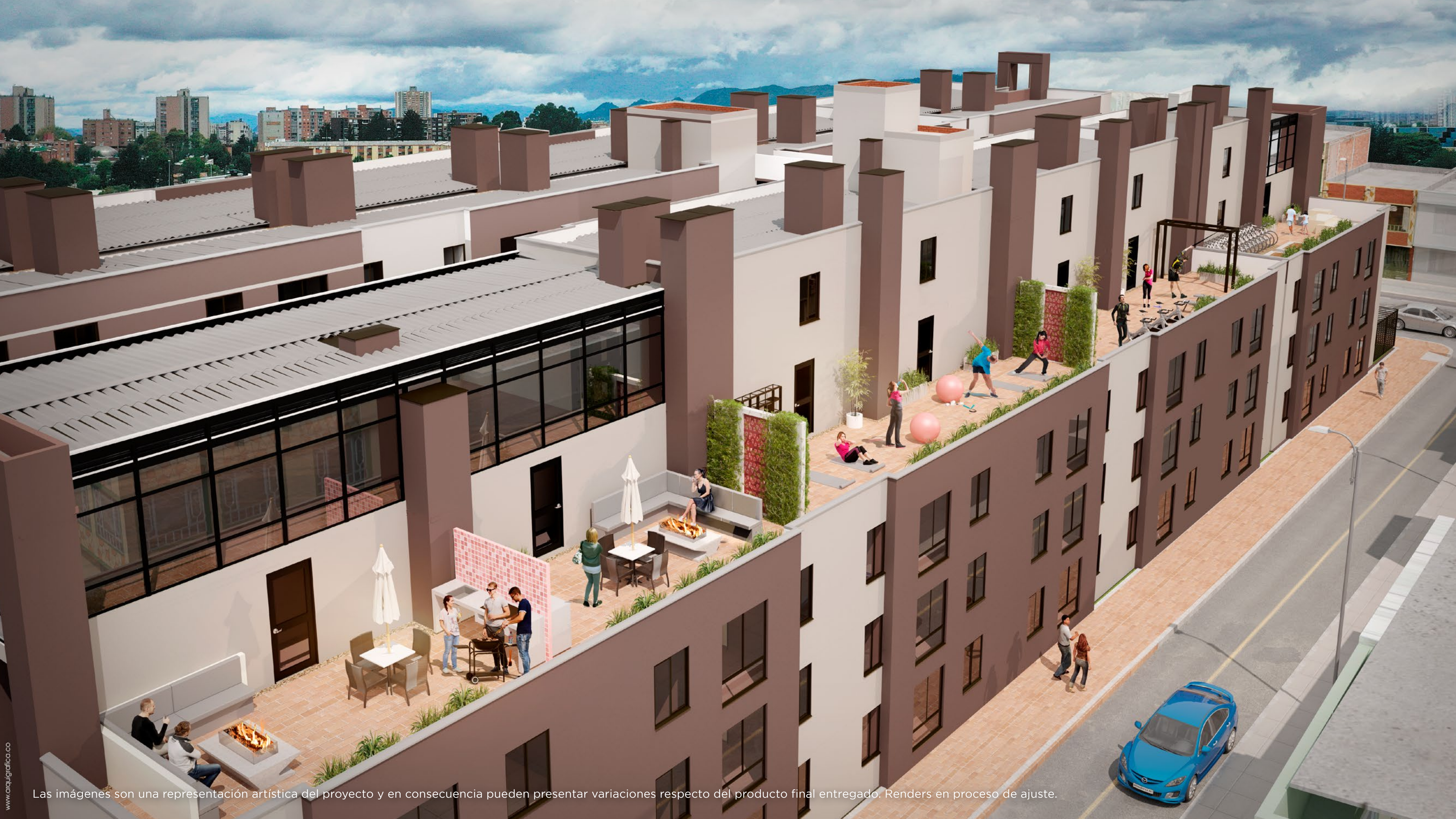
Las imágenes son una representación artística del proyecto y en consecuencia pueden presentar variaciones respecto del producto final entregado. Renders en proceso de ajuste.