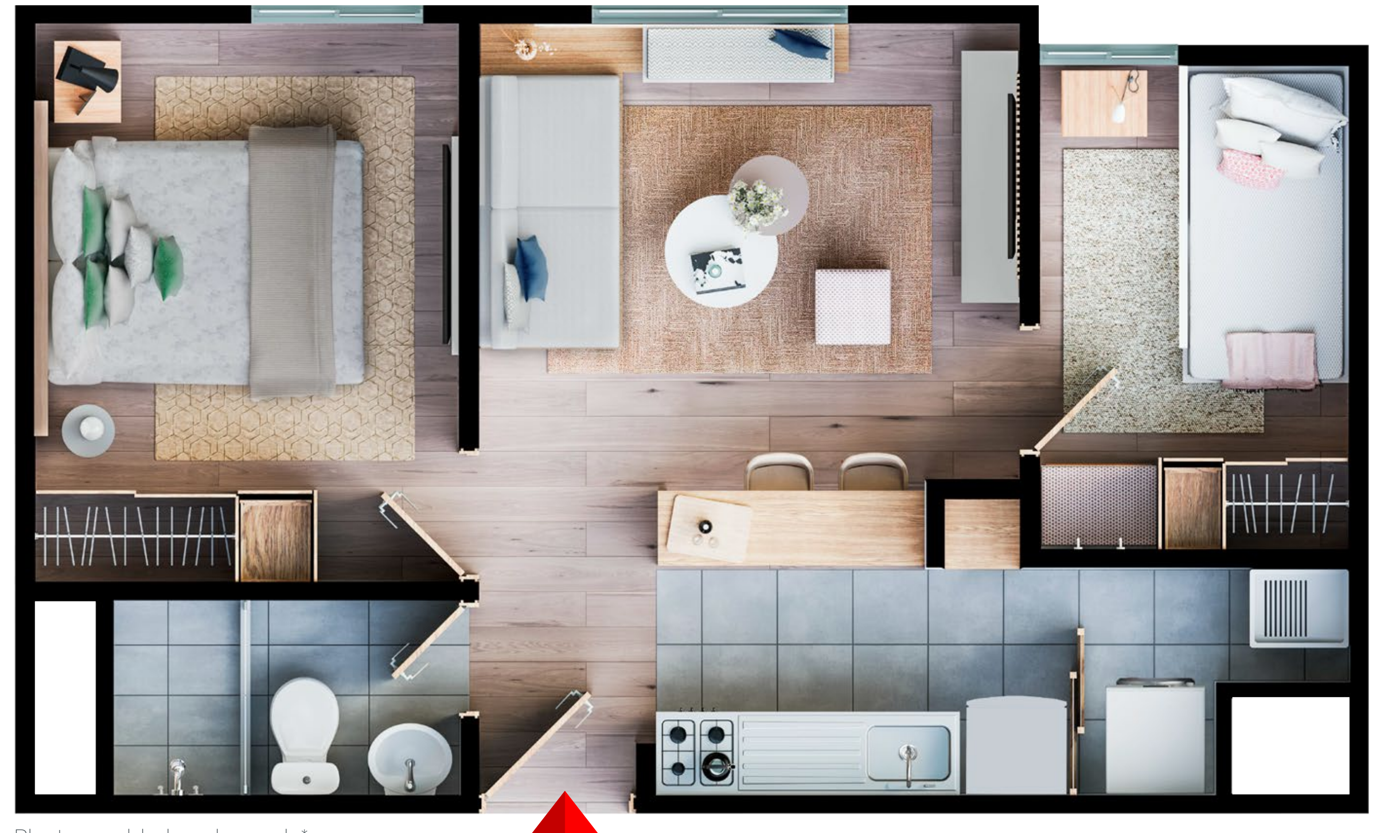
Planta amoblada y decorada*