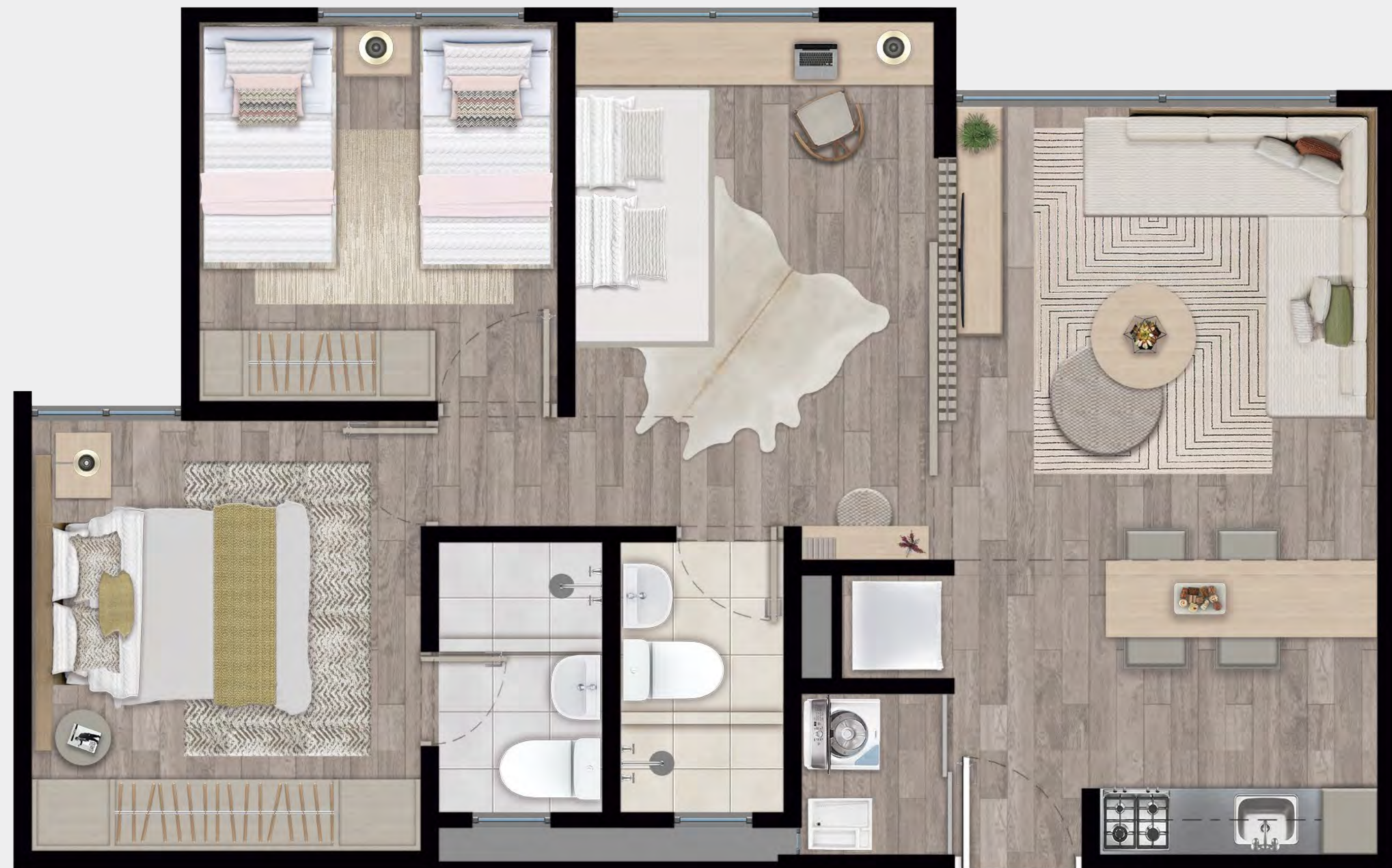
Planta amoblada y decorada*