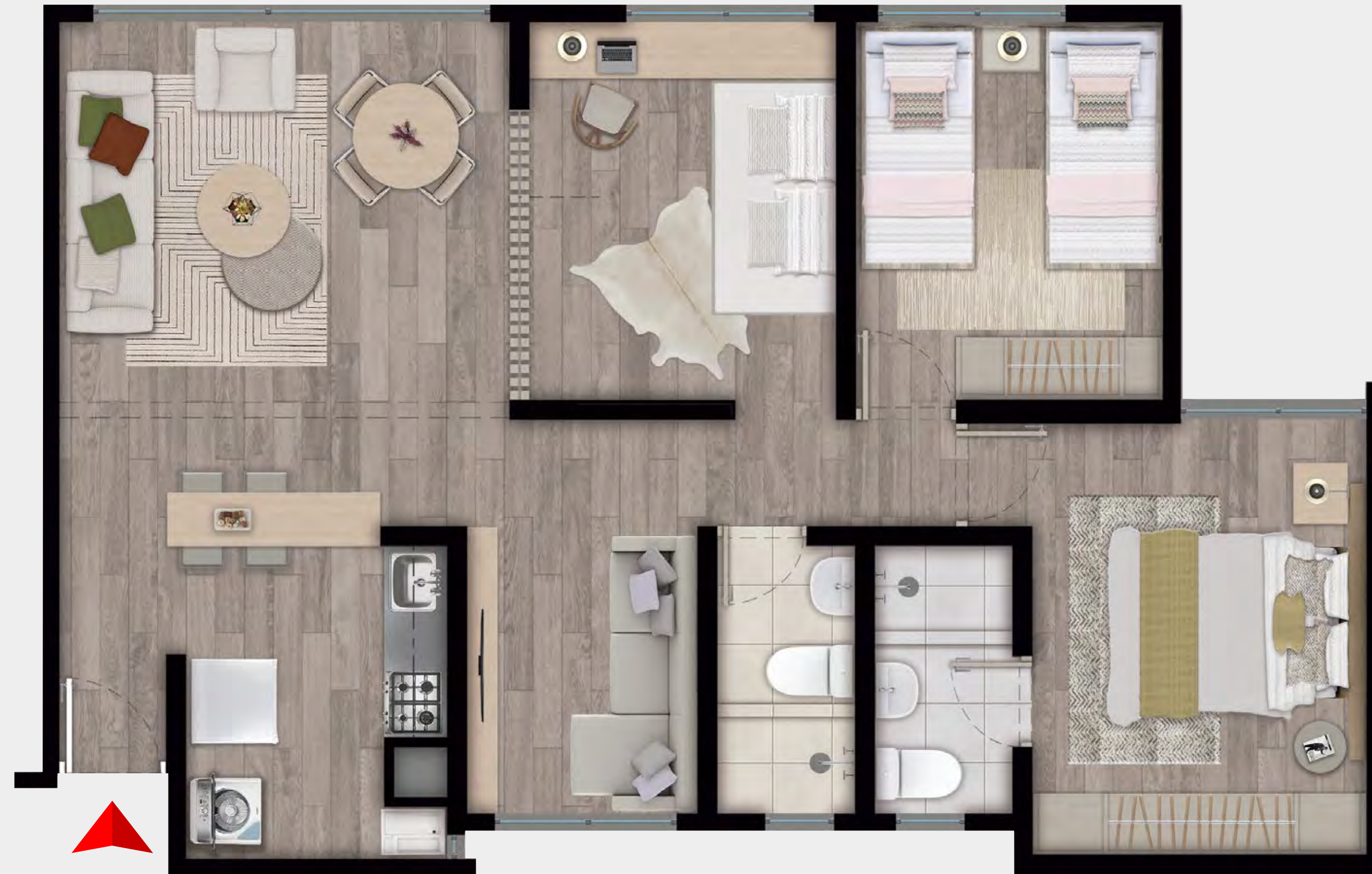
Planta amoblada y decorada*

*Los apartamentos se entregarán con semiacabados. Consulta con tu asesor. Las imágenes son una representación artística del proyecto y en consecuencia pueden presentar variaciones respecto del producto final entregado. Los datos publicados pueden variar sin previo aviso. El constructor se reserva el derecho a efectuar los cambios que considere necesarios por materiales y acabados similares a las propuestas sin previo aviso.